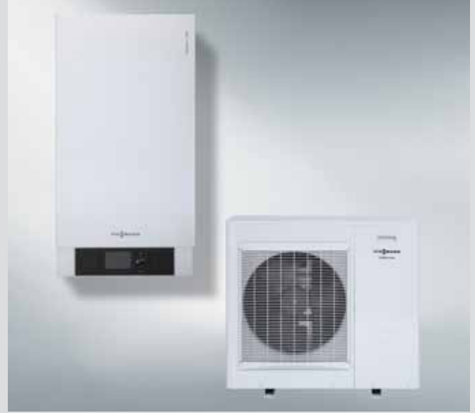
Vitocal 200-S hava kaynaklı ısı pompası, iç ve dış ünite

Kullanımı kolay Vitotronic 200 kontrol panelinin avantajlarından teknik uzman gibi son kullanıcı da yararlanır: Türkçe menüli kontrol paneli kolay anlaşılır şekilde tasarlanmıştır. Büyük ekranı ışıklıdır ve kolayca okunabilir. Yardım fonksiyonu ile tüm adımlar tarif edilmektedir. Grafik destekli kullanıcı seviyesinde ısıtma ve soğutma eğrileri görüntülenmektedir. Dış hava kompanzasyonlu işletmeye uygundur.