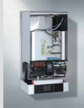
Vitocal 200-S iç ünite

Vitocal 200-S hava kaynaklı ısı pompası Başka ısı üreticileri ile hibrit sistem olarak işletilebilir.